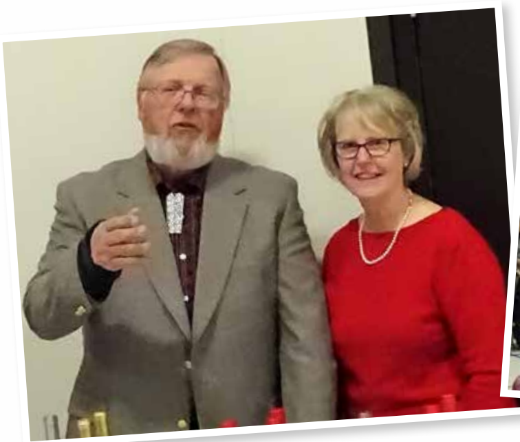
The Valentine's Day Dinner is a chance for couples to enjoy an evening out without the hassle of long waits at a restaurant.