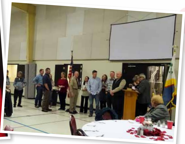
Spending time away with your beloved is a great opportunity to reconnect and celebrate your relationship — why not celebrate and connect with other couples in our parish, as well?