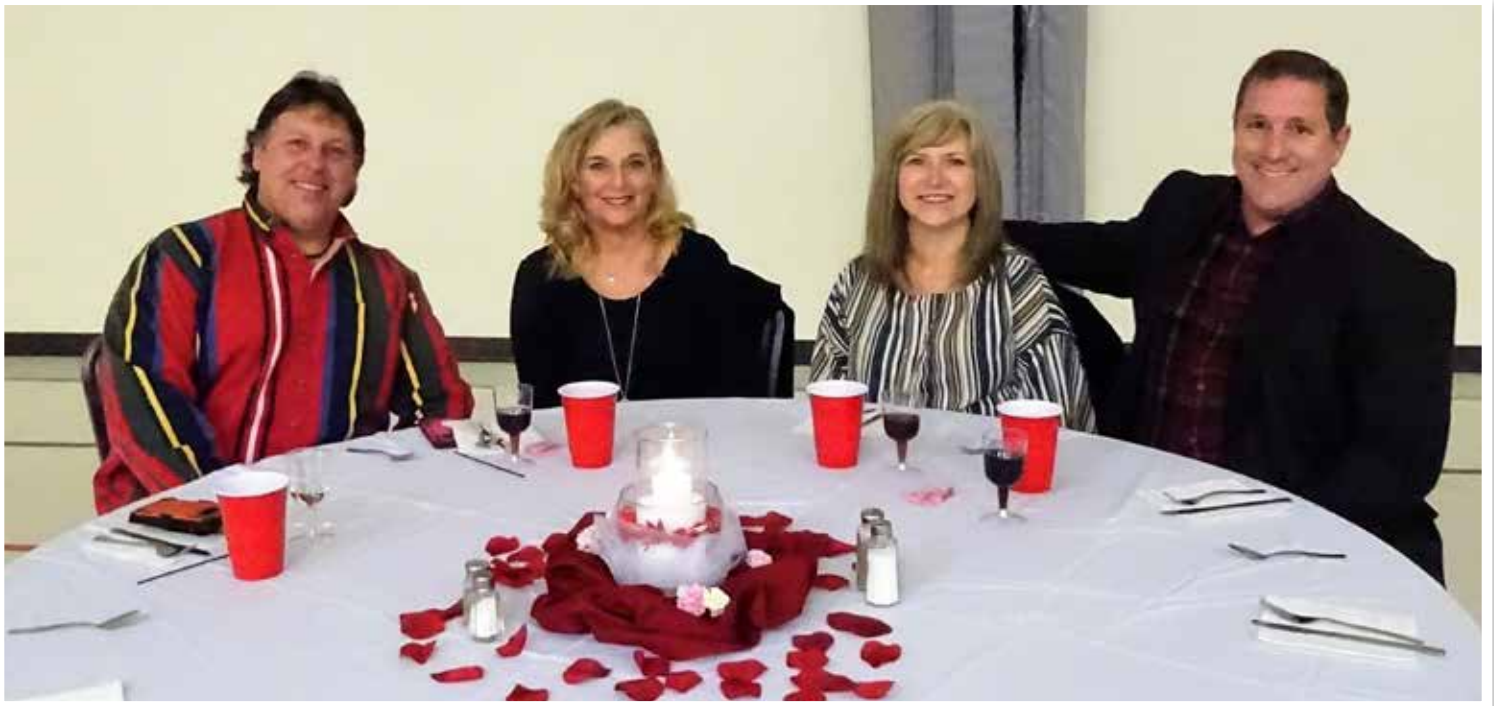
Each year, the Knights of Columbus host a Valentine's Day Dinner for couples to celebrate that special someone in their life.