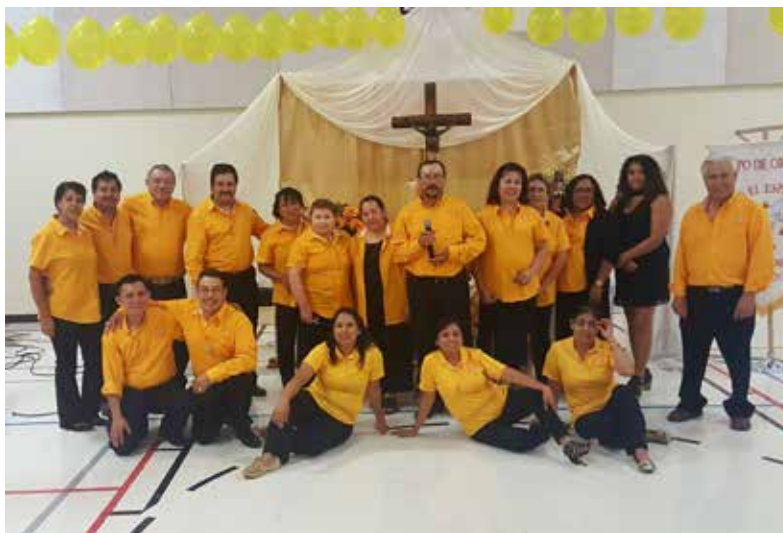
Members of the Spanish Prayer Group

El Grupo de Oración en español tradicionalmente se reúne los Vienes por la tarde de 7 p.m. a 9 p.m y sirve como un proceso de catechesis de un año. Los temas