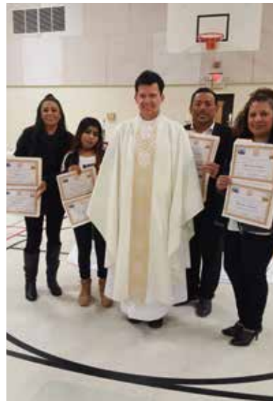
Spanish Prayer Group members holding up their certificates of completion

Lucas. "Así es como crecieron. El Grupo de Oración en español se trata de renovar su vida en la fe católica, ayudándoles a conocer la Biblia para que puedan leer y comprender la Palabra de Dios y saber de qué se trata realmente la fe."